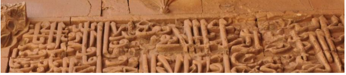
Kitabenin kapının batı duvarındaki kısmı