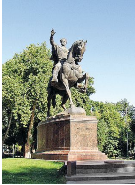
Timur'un Taşkent'teki heykeli

Timur, başarılarının yazılarak şahsının ölümsüzleştirilmesini arzu ettiğinden seferleri sırasında kâtiplerine Türkçe ve Farsça günlük tutturuyordu. Bu sebeple Nizâmeddîn-i Şâmî ve Şerafeddin Ali Yezdî'in Zafernâme'leri onun hayatı için en önemli kaynaklardır. Timur'un, ele geçirdiği ülkelerden Semerkant'a götürdüğü sanatkârlar içinde bazı musiki şinaslar da bulunuyordu. İbn Arabşah'ın Timur devri hânendeleri arasında saydığı Abdüllatîf Damganlı, Mahmud ve Cemâleddin Ahmed Hârizmlî, Abdülkâdir b. Gaybî Meragalı olup Celâyirli sarayından getirilmişti. Bu dönemde mûsikide özellikle iki kişinin adından üstat diye söz edilir. Bunlardan biri Endicanlı Yûsuf, diğeri Abdülkâdir-i Merâgî'dir. Timurlular devri resim sanatının kaynağı Bağdat, Tebriz ve Şîraz okullarıdır. Timur bu şehirleri ele geçirdikten sonra buralardaki sanatkârlardan bazılarını Semerkant'a götürmüş, daha sonra onlardan bir kısmı torunu Gıyâseddin Baysungur tarafından Herat'ta toplanmıştı. İbn Arabşah, Timur devrinin en büyük nakkaşı olarak Bağdatlı Abdülhay Hâce'yi anmaktadır. 9