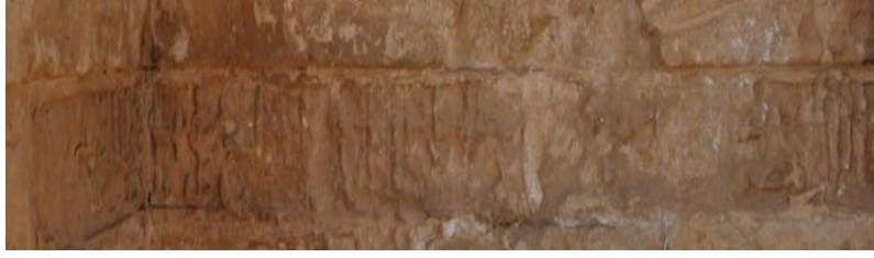
Çeşme kitabesinin bugünkü durumu

Bulunduğu Yapı ve Yer: Sultan İsa Medresesi ana girişinin batısında kalan çeşmenin iç yüzünde yer almaktadır.