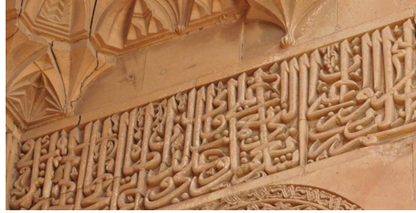
Kitabenin kapı alınlığındaki bölümünün ilk kısmı