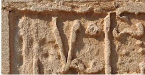
Çeşmenin doğusunda yer alan kitabe parçası

Bunun inşasını efendimiz, es-Sâlih (Melik Salih) (oğlu) el-Muzaffer (Melik Davud) oğlu es- Sultanü'l-Âdil (Melik İsa)..... emretti.