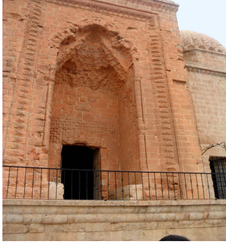
Kasımiye Medresesi girişi

döküldüğünde duvardaki kan izleri belli olmuştuydu, duvarlardaki kan izlerinin bunlara ait olduğu söylenir.