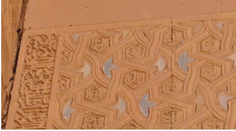
Kapı alınlığında bulunan Esmâü'l-Hüsnâ kitabesinden detay