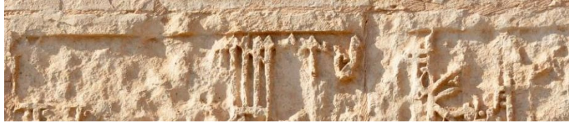
Medrese duvarının güney yüzünün çatısında bulunan kitabe parçası. 10

Kitabe, tercüme ve değerlendirmeler dip nota yazılı tezden alınmıştır.