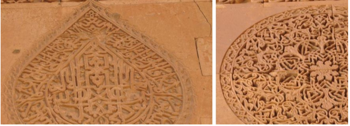
Kapı alınlığındaki âyet kitabesi: Kapının doğu ve batı duvarında bulunan süslemeli madalyon

Değerlendirme: Artuklulara ait son kitabeler Sultan Melik Zâhir İsa'ya ait olup, bunlardan günümüze ulaşanlardan tamamını kendisinin yaptırdığı ve vakfettiği Sultan İsa (Zinciriyye) medresesinde bulunmaktadır.